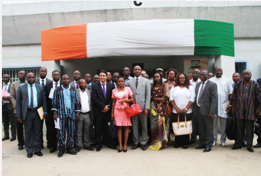
Photo de famille lors de la clôture des « Séminaires pour tous » en présence des participants de 9 pays africains.

Les «Séminaires pour tous» de 2018 seront ainsi dispensés exceptionnellement une seule fois dans chacun des 4 pays suivants : Burkina Faso, Côte d'Ivoire, Sénégal et Mali.