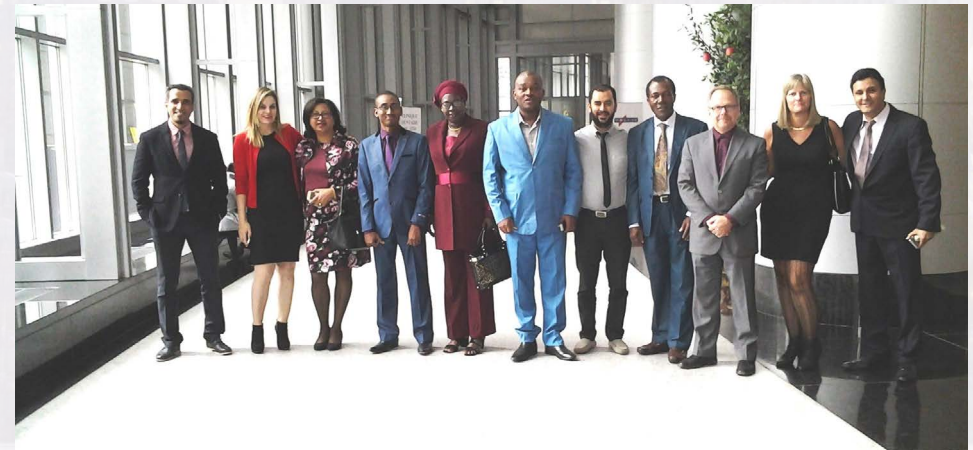
Séminaire GAR et bonne gouvernance (Montréal, siège social, 2016)