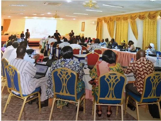
Séminaires pour tous en Planification - suivi de projets et Gestion axée sur les résultats avec 49 participants en provenance de 10 pays africains (Ouagadougou, mai 2017, Hôtel Palm Beach).