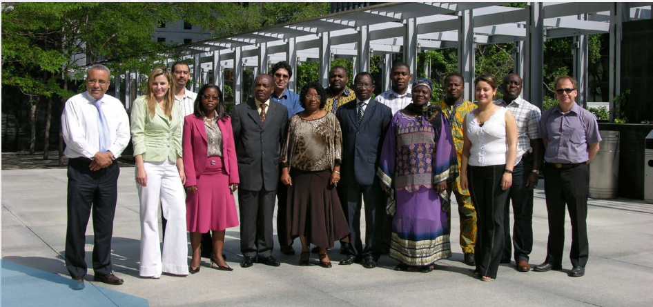
Stagiaires de MDS en gestion axée sur les résultats (Siège social de MDS, 2013)