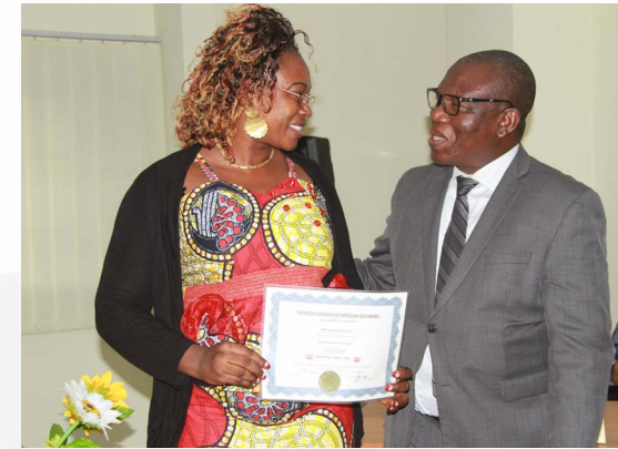
Remise du Certificat canadien MDS de formation portant la mention agréé par l'État du Québec par le DG de l'AGEFOP ( Abidjan, Août 2017)

Les «Séminaires pour tous» de 2018 seront ainsi dispensés exceptionnellement une seule fois dans chacun des 4 pays suivants : Burkina Faso, Côte d'Ivoire, Sénégal et Mali.